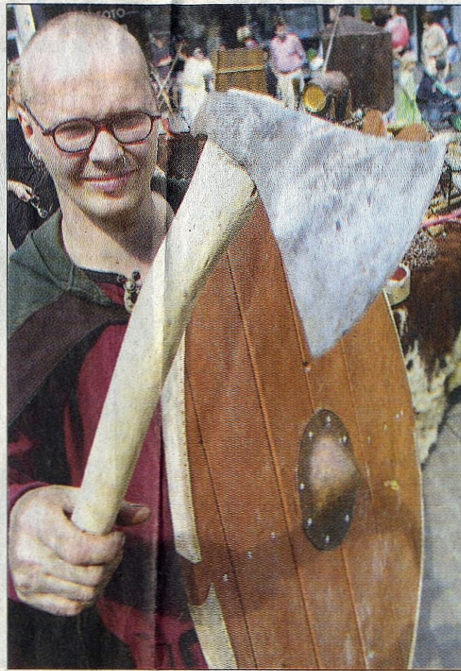
Fossi, der Gabelkönig: Die Kelten aus Essen lagerten am Wochenende auf dem Altstadtmarkt.

und ihren Gästen vorzustellen. Infobroschüren lagen aus, und kompetente Gesprächspartner ließen sich geduldig ausfragen. Kulinarisches gab's dort auch: Lokale Köstlichkeiten in fester und flüssiger Form waren an den Ständen zu kosten.