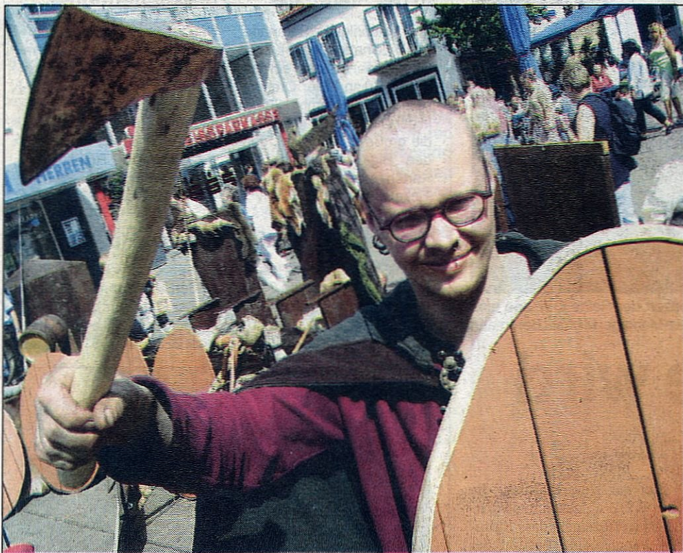
Germanen auf dem Dorstener Markt: Historische Kostüme bestimmten das Bild beim Hansefest in der Dorstener Innenstadt.

Zwei neue Mitglieder hat der Westfälische Hansebund seit Samstag: Die Städte Hamm und Marsberg traten bei der Delegiertentagung in der VHS dem 1983 gegründeten Bund bei.