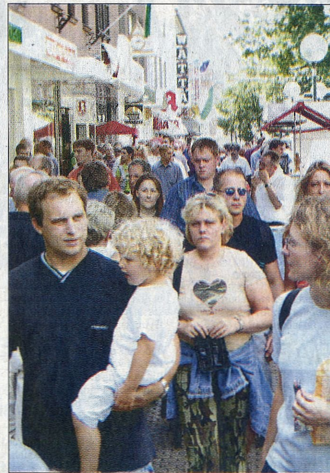
Viel Publikum war an den beiden 18. Westfälischen Hansetagen in der Altstadt unterwegs.

Auf der Bühne reichten sich am Nachmittag die Akteure die Mikros weiter: Der Schermb-